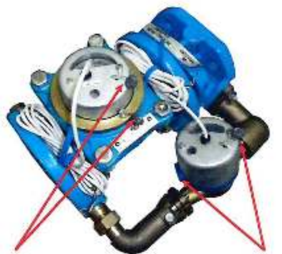
б) Счетчик холодной воды комбинированный ВСХНКд-50/20